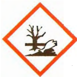
Hazardous to the aquatic environment