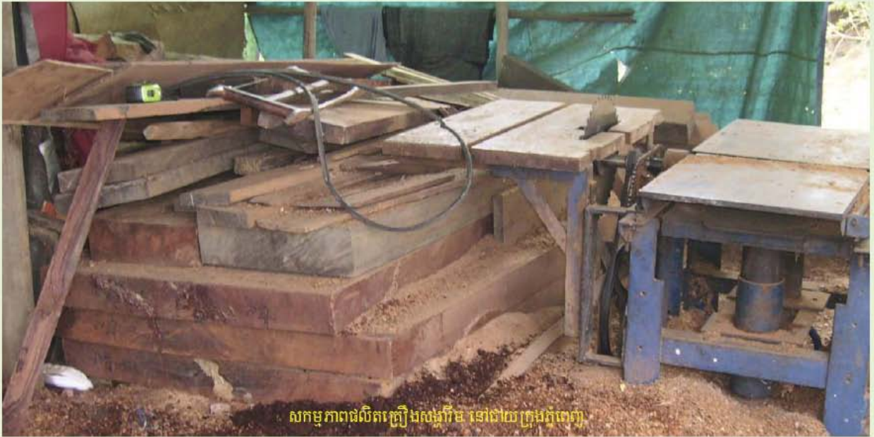
សកម្មភាពផលិតគ្រឿងសង្ហារឹម ទៅជ្រោយ ក្រុងភ្នំពេញ

អត្ថបទដោយបណ្តាញគំរោងព្រៃឈើ និងចំការឈើដាំវេទិការនៃអង្គការមិនមែនរដ្ឋាភិបាល ស្តីពីកម្ពុជា ។