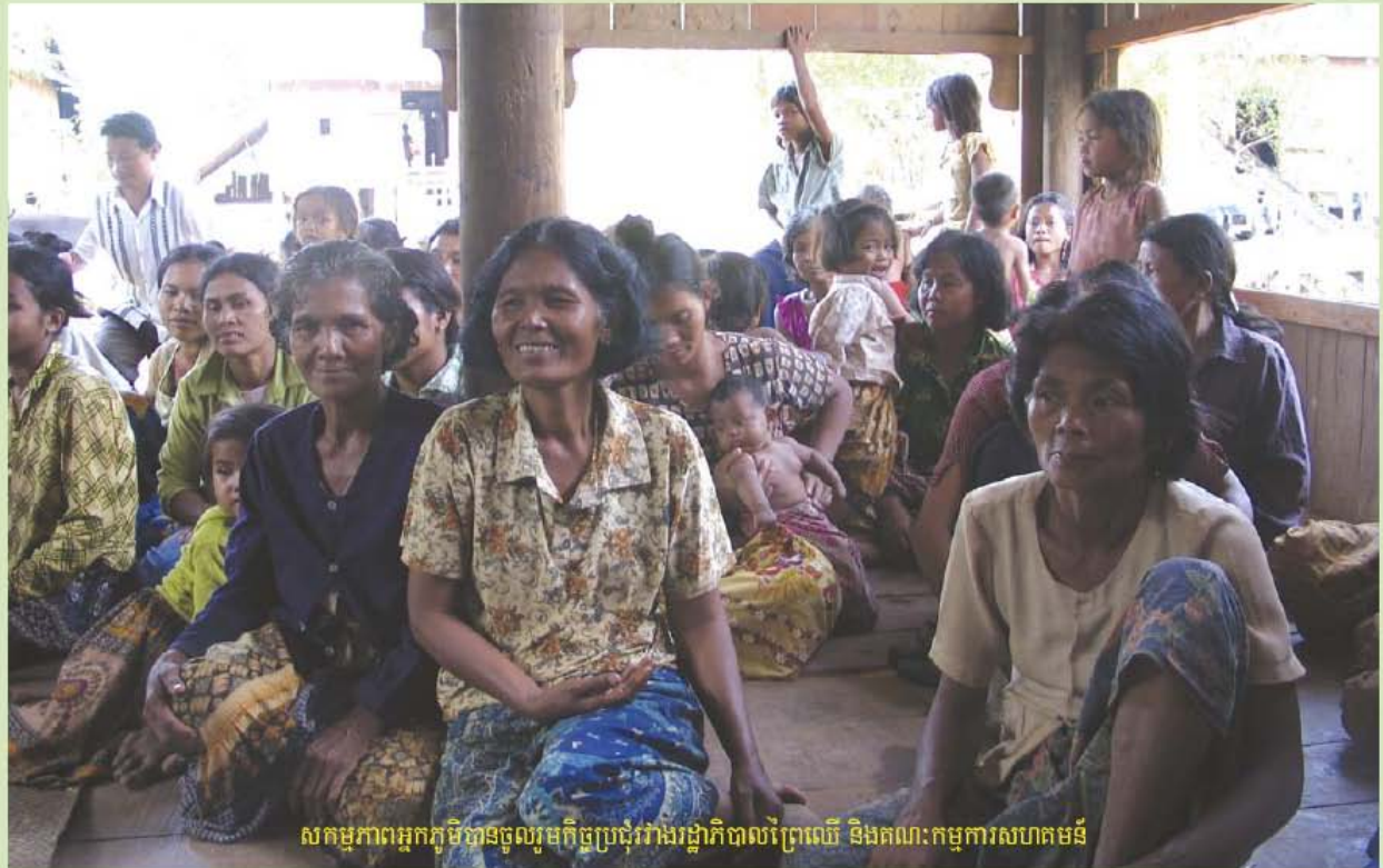
សកម្មភាពអ្នកភូមិមានចូលរួមកិច្ចប្រជុំរវាងរដ្ឋាភិបាលព្រៃឈើ និងគណៈកម្មការសហគមន៍

អត្ថបទដោយដោយបណ្តាញព្រៃឈើ និងចំការឈើដាំនៃ វេទិកានៃអង្គការមិនមែនរដ្ឋាភិបាល ស្តីពីកម្ពុជា