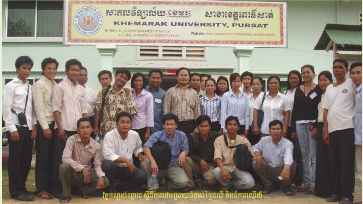
វគ្គបណ្តុះបណ្តាល ស្តីពីការដោះស្រាយទំនាស់ព្រៃឈើ និងចំការឈើដាំ