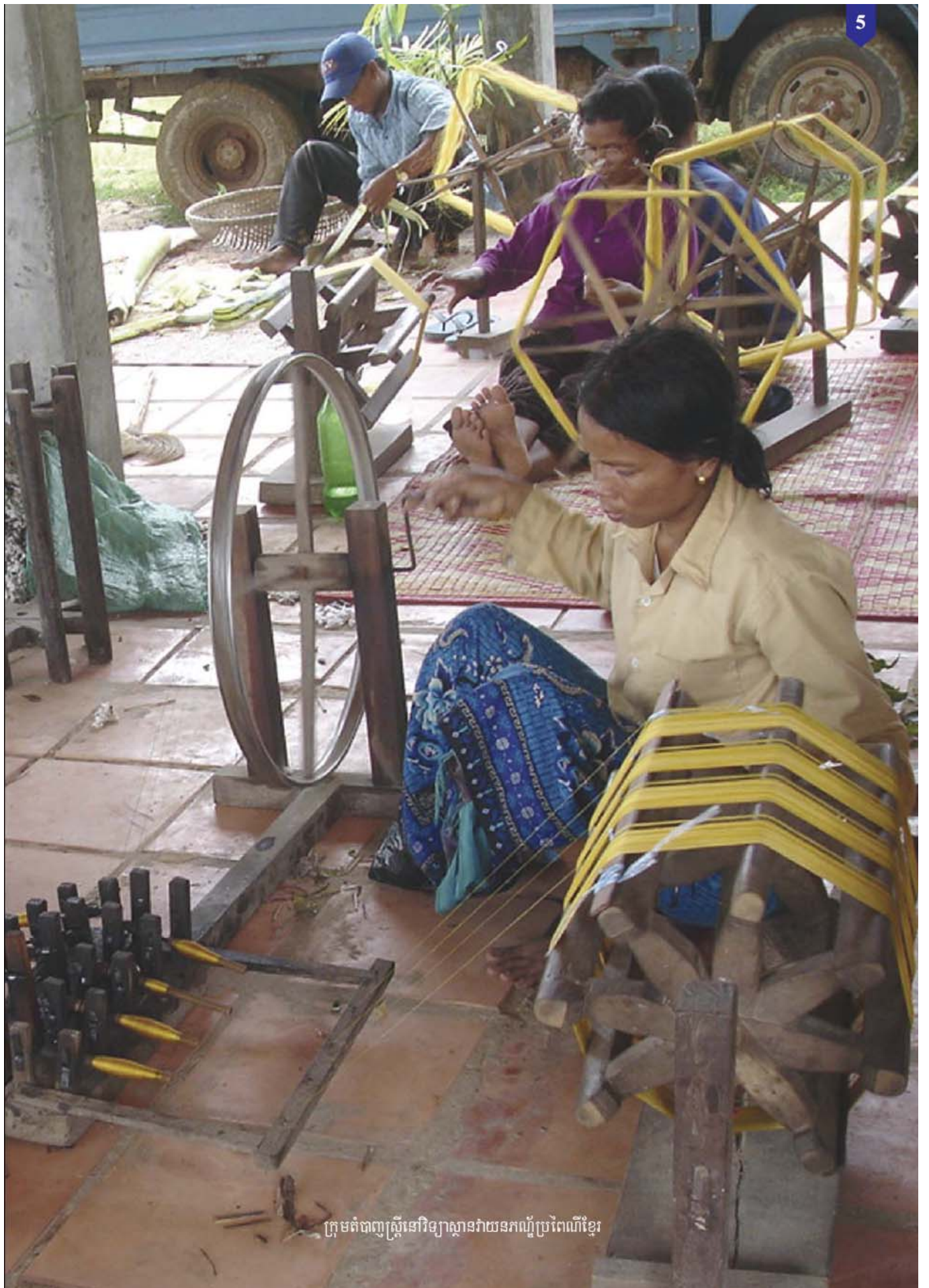
ក្រុមគំព័ន្ធស្រ្តីនៅឡាស្ថានវាដទកល្បីប្រពៃណីខ្មែរ