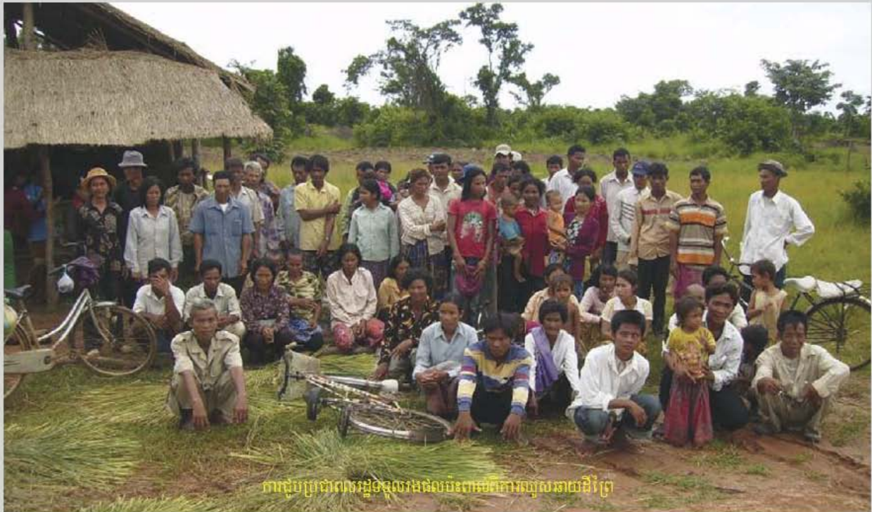
ការជួបប្រជាពលរដ្ឋទទួលរងផលប៉ះពាល់ពីការស្នូលនាយដីព្រៃ