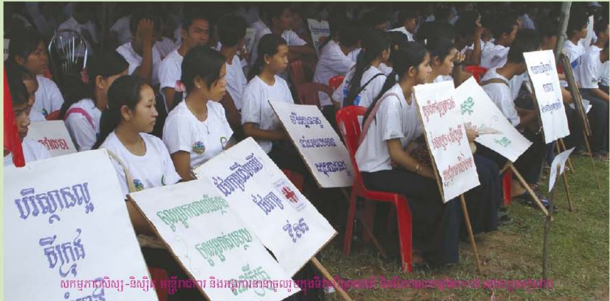
សកម្មភាពសិស្ស-និស្សិត មន្ត្រីរាជការ និងអង្គការនានាចូលរួមក្នុងទិវាពិភពលោក ទី៧៧នាពេលបច្ចុប្បន្ន ថ្ងៃ សុក្រ ១២ ខែ កញ្ញា ២០១៧

នាពេលបច្ចុប្បន្ននេះ មានស្ថាប័ន និងអង្គការនានាបាននឹងកំពុងធ្វើការយ៉ាង សកម្មលើការងារលើកកំពស់ ស្ត្រីនៅក្នុងការគ្រប់គ្រងធនធានធម្មជាតិ និង កិច្ចការពារបរិស្ថាននេះ ។ ប៉ុន្តែស្ថាប័ន និងអង្គការទាំងនោះបានជួបប្រទះ បញ្ហាជាច្រើនដែលពាក់ព័ន្ធ និងចំណេះដឹងអំពីយេនឌ័រមានការរើសអើង ចំពោះស្ត្រីនៅតាមតំបន់មួយចំនួន ការលើកកំពស់ស្ត្រីនៅពុំទាន់ទូលំទូលាយ ការចូលរួម និងចំណេះដឹងរបស់ស្ត្រីនៅមានកំរិតនៅឡើយ និងការផ្តល់អោយ ឱកាស និងអំណាចអោយស្ត្រីនៅមិនទាន់ពេញលេញនៅឡើយផងដែរ ។ បញ្ហាទាំងនេះអាចដោះស្រាយទៅបានដរាបណាស្ថាប័ន ឬអង្គការពាក់ព័ន្ធ ដែលជាដៃគូដែលធ្វើការងារនេះមានសមត្ថភាព បទពិសោធន៍ច្រើនសំរាប់ជួយ សំរួលដល់ការបញ្ជ្រាប និងលើកកំពស់យេនឌ័រនៅក្នុងការគ្រប់គ្រងធនធាន ធម្មជាតិ ។ ដំណោះស្រាយនេះមានតែការចូលរួមផ្តល់បទពិសោធន៍ និងចំណេះ ដឹងរវាងគ្នាទៅវិញទៅមកអំពីឧទាហរណ៍ជាក់ស្តែងក្នុងការធ្វើការងារជាមួយ ស្ត្រី ។ ដើម្បីគ្រប់គ្រងអោយបាននូវធនធានធម្មជាតិ និងបរិស្ថាន តួនាទីរបស់ ស្ត្រីមានសារៈសំខាន់ណាស់ ។