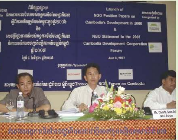
8 5 2007