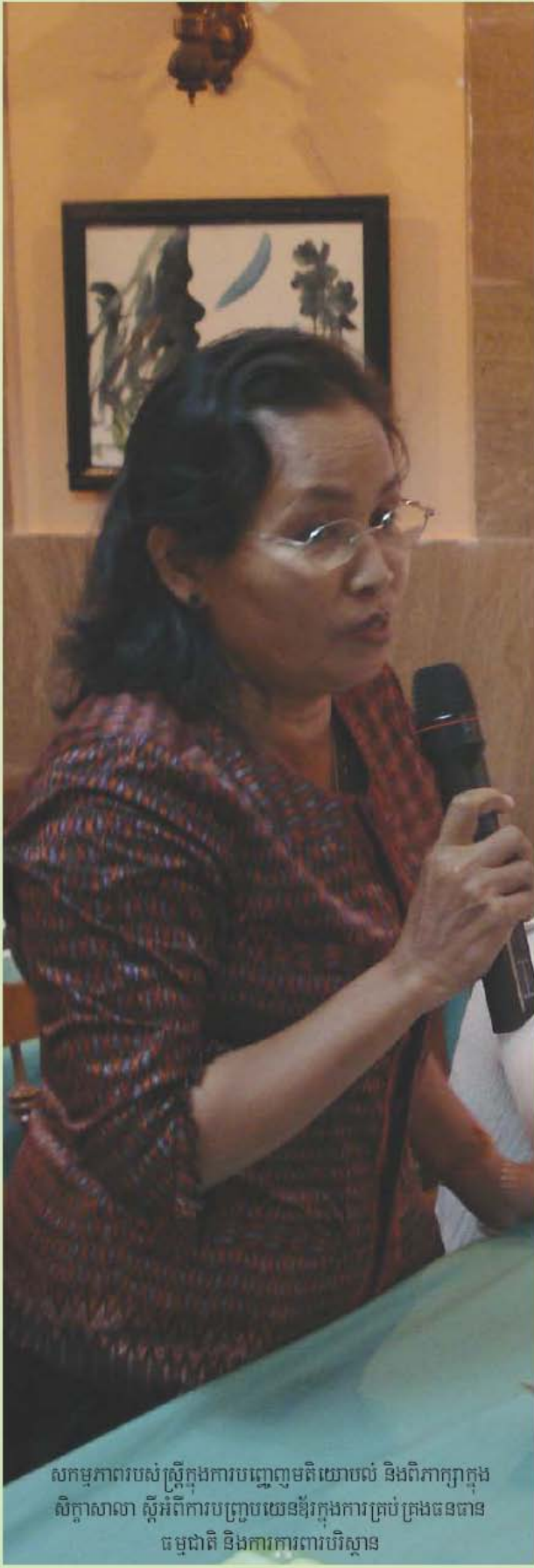
សកម្មភាពរបស់ស្ត្រីក្នុងការបញ្ជ្រាបយេនឌ័រ និងពិភាក្សាក្នុងសិក្ខាសាលា ស្តីអំពីការបញ្ជ្រាបយេនឌ័រក្នុងការគ្រប់គ្រងធនធានធម្មជាតិ និងការការពារបរិស្ថាន

យេនឌ័រមានតួនាទីយ៉ាងសំខាន់នៅក្នុងប្រទេសកម្ពុជាដោយបានអំណោយផលអោយស្ត្រីមានទំនាក់ទំនងយ៉ាងជិតស្និទ្ធជាមួយនិងធនធានធម្មជាតិដូចជា ព្រៃឈើ ទឹកដី និងសត្វព្រៃជាដើមនៅក្នុងប្រទេសកម្ពុជា។ ស្ត្រីទាំងនោះបានប្រើប្រាស់ និងអភិរក្សនូវធនធានធម្មជាតិទាំងឡាយដើម្បីផ្គត់ផ្គង់នូវតំរូវការចាំបាច់នានាសំរាប់គ្រួសារ សហគមន៍ និងជាតិ ។ ដូចនេះ ការអភិរក្សធនធានធម្មជាតិនៅតាមតំបន់ជនបទនានាមិនអាចធ្វើទៅបានជោគជ័យទេដរាបណាមិនការចូលរួមរបស់ស្ត្រី។ ស្ត្រីច្រើនតែពឹងផ្អែកលើធនធានដែលមាននៅជុំវិញភូមិ និងព្រៃជិតខាងសំរាប់ចិញ្ចឹមគ្រួសាររបស់ខ្លួន។ បុរស និងស្ត្រីសុទ្ធតែបានរួមវិភាគទានយ៉ាងសំខាន់ដល់គ្រួសារ និងសហគមន៍ទាំងមូលគ្រាន់តែវិភាគទាន