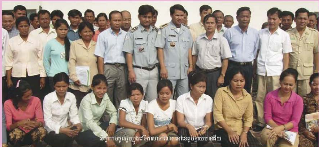
សណ្តកាមចូលរួមក្នុងវេទិកាសាធារណៈ នៅខេត្តបន្ទាយមានជ័យ