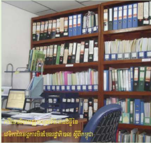
រូបខាងលើគឺជាកន្លែងដែលផ្ទុកនូវរាល់ព័ត៌មានទាំងឡាយដែលទទួលបានពីអង្គការដៃគូ បណ្តាញ សហគមន៍ ភ្នាក់ងាររដ្ឋាភិបាល ប្រព័ន្ធផ្សព្វផ្សាយ និងជាកន្លែងសំរាប់ដំណើរការផលិតទិន្នន័យទាំងឡាយដែលទទួលបាននោះសំរាប់ជួយគាំទ្រដល់ដំណើរការតស៊ូមតិរបស់ពួកគេវិញ ។

លោក ហិច សុខាន់ណារ៉ូ អ៊ីម៉ែល: sokhannaro@ngoforum.org.kh ទូរស័ព្ទ: ០២៣ ២១៤ ៤២៩ ភ្ជាប់បន្ត ១១១