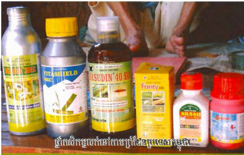
ថ្នាំកសិកម្មលក់នៅតាមត្រីដងប្រទេសកម្ពុជា