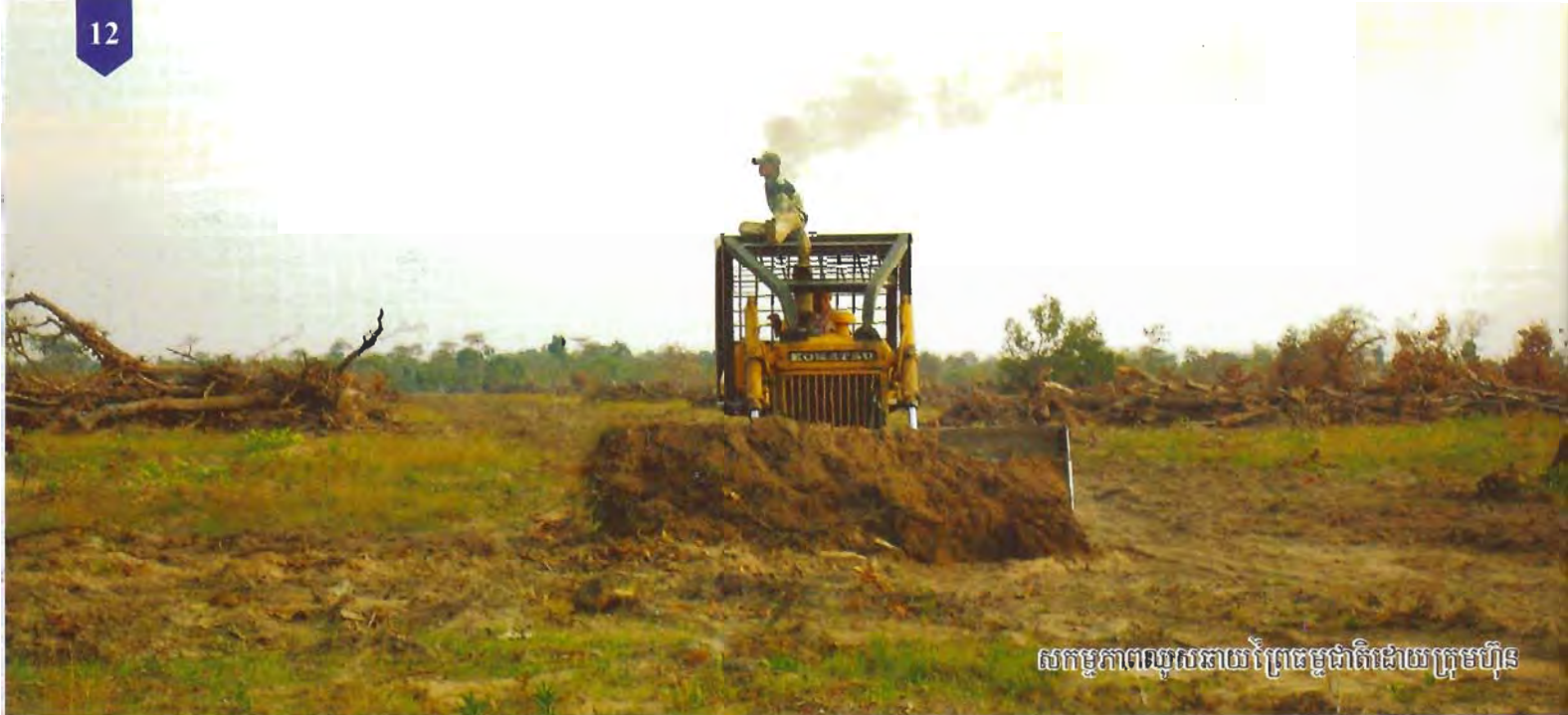
សកម្មភាពសាងសង់ប្រព័ន្ធធាតុដោយក្រុមហ៊ុន

ចំដើមទ្រូងដោយសារគាត់បាននិយាយហាមឃាត់មិនអោយបរាជ័យសត្វព្រៃ និងនិយាយពីរឿងព្រេងល្អ ។