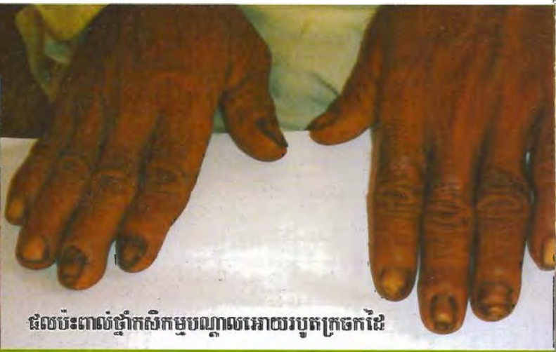
ផលប៉ះពាល់ថ្នាំកសិកម្មបណ្តាលអោយរបកក្រចកដៃ