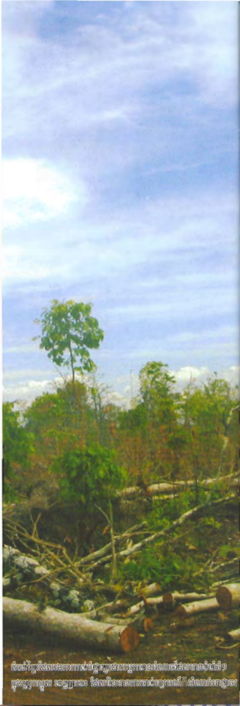
តំបន់ព្រៃដែលរងការកាប់បំផ្លាញដោយអ្នកមានអំណាចដែលមានទំហំធំៗ ក្នុងស្រុកស្នួល ខេត្តក្រចេះ ដែលមិនមានការចាប់អារម្មណ៍ពីសំណាក់អាជ្ញាធរ

ជីវិតដ៏ស៊ាំញ័ររបស់គាត់ ប្រពន្ធគាត់ និងកូនប្រុសរបស់គាត់ នៅក្នុងពន្ធនាគារ គឺជាមេរៀនដ៏សែនអប្រិយសំរាប់សកម្មជនដទៃទៀត។ អ្វីដែលគួរឱ្យសន្និដ្ឋានបានថា វាជាការរៀបចំទុកជាមុននោះ គឺដោយសារតែ ក្នុងកំឡុងចុងឆ្នាំ២០០៥ និងដើមឆ្នាំ២០០៦ មានករណីស្រដៀងគ្នាកើត ឡើងស្ទើរគ្រប់តំបន់ដែលមានវិវាទដីធ្លី ហើយសហគមន៍ ឬសកម្មជនទាំង នោះតែងតែទទួលបាននូវការធ្វើទុក្ខបុកម្នេញដោយការគំរាមបំភិតបំភ័យ ការបង្ករបួសស្នាម ការឃុំខ្លួន។ល។ ចំពោះគ្រួសារ និងមិត្តភក្តិរបស់គេគឺ ទទួលបានទឹកភ្នែក និងភាពភ័យខ្លាច។