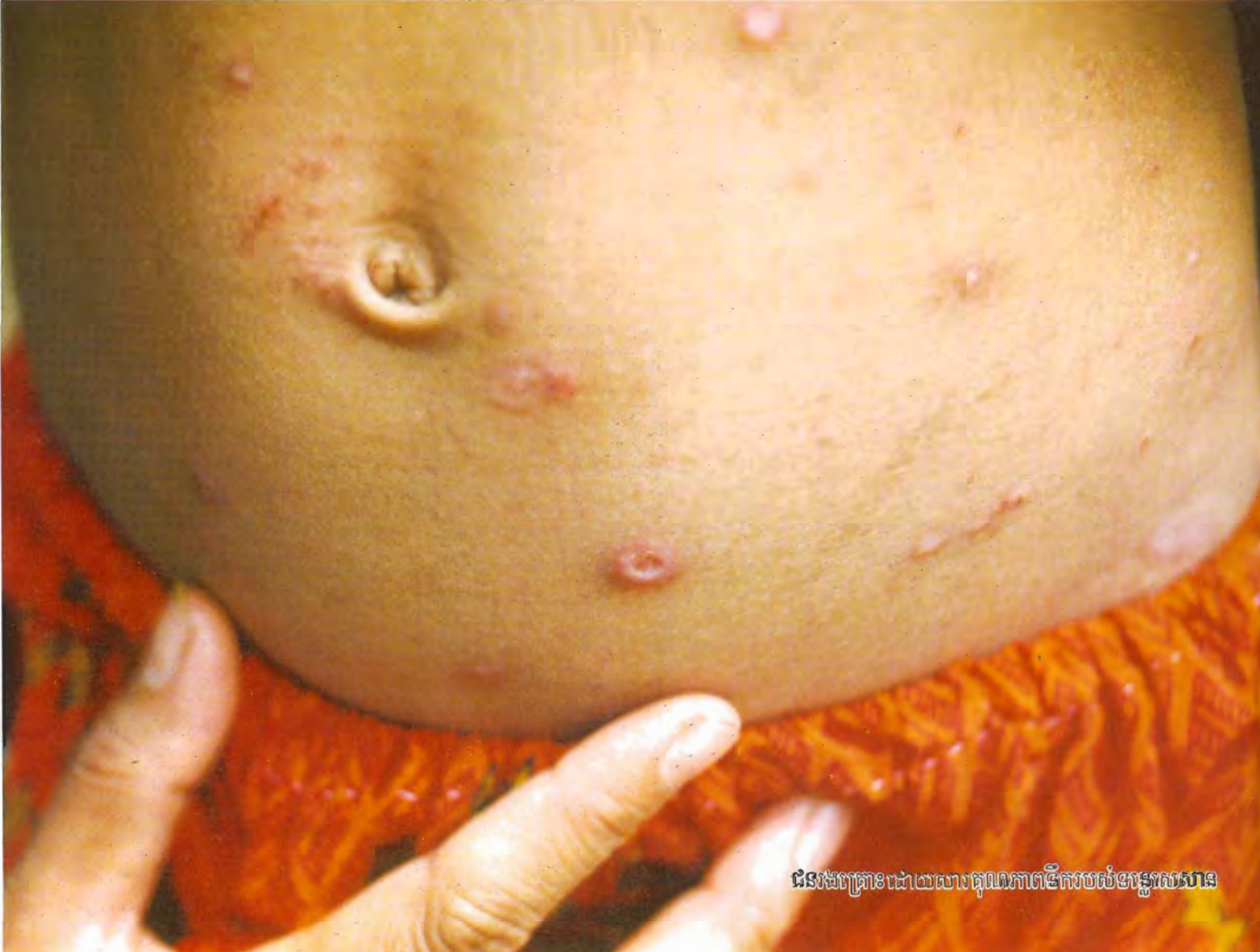
ជនរងគ្រោះដោយការគុណភាពទឹករបស់ទន្លេសេសាន

អត្ថបទនេះត្រូវបានចុះផ្សាយដំបូងនៅក្នុង Development Today លេខ ៩ ថ្ងៃទី៣០ ខែមិថុនា ឆ្នាំ២០០៦។