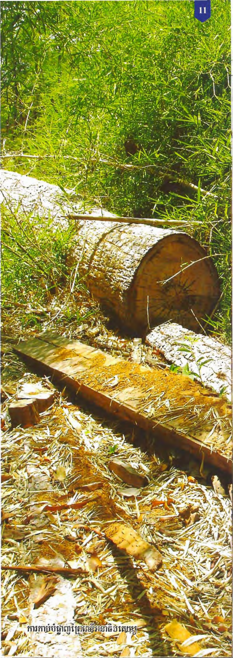
ការកាប់បំផ្លាញព្រៃឈើអនាមិកបេង

តំណាងសហគមន៍ម្នាក់និយាយពីការលំបាករបស់ពួកគាត់ព្រោះថារយៈពេលឆ្នាំហើយដែលសហគមន៍របស់គាត់បានបង្កើតឡើងរំពឹងមិនទាន់មានការទទួលស្គាល់ដូចឃុំផ្សេងៗទៀតនៅឡើយ គឺបណ្តាលមកពីមេប៉ូស្តី មេឃុំត្រូវគ្នាមិនអោយមានការទទួលស្គាល់សហគមន៍ព្រៃឈើ ។ តំណាងសហគមន៍បន្តទៀតថា រាល់ថ្ងៃនេះប្រជាពលរដ្ឋមានការភ័យខ្លាចយ៉ាងខ្លាំងព្រោះកាលពីឆ្នាំ២០០៥ សមាជិកសហគមន៍ម្នាក់ត្រូវបានប្រជាពលរដ្ឋដូចគ្នាបាញ់