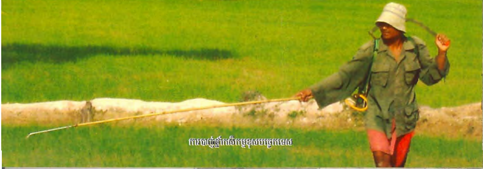
ការបាញ់ថ្នាំកសិកម្មខ្ពស់បច្ចេកទេស