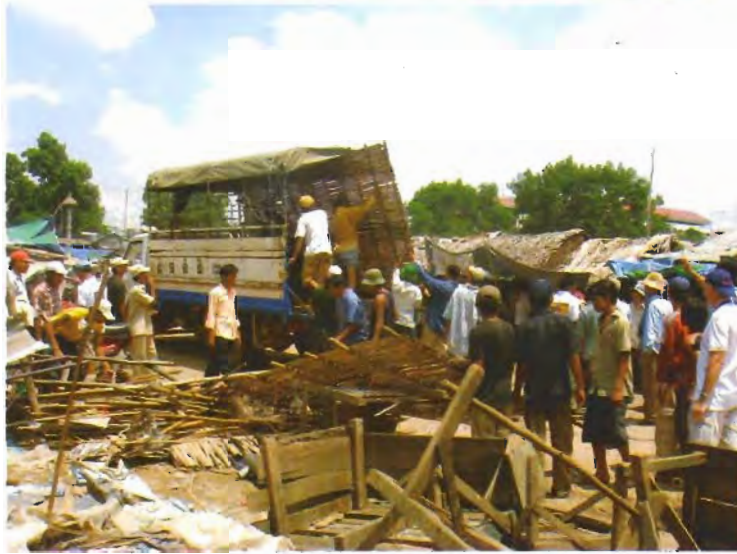
អ្នកស្រុករៀបចំជំនួសសំភារៈជាក់លើ រថយន្តទៅកាន់ទីតាំងសំនៅថ្មី