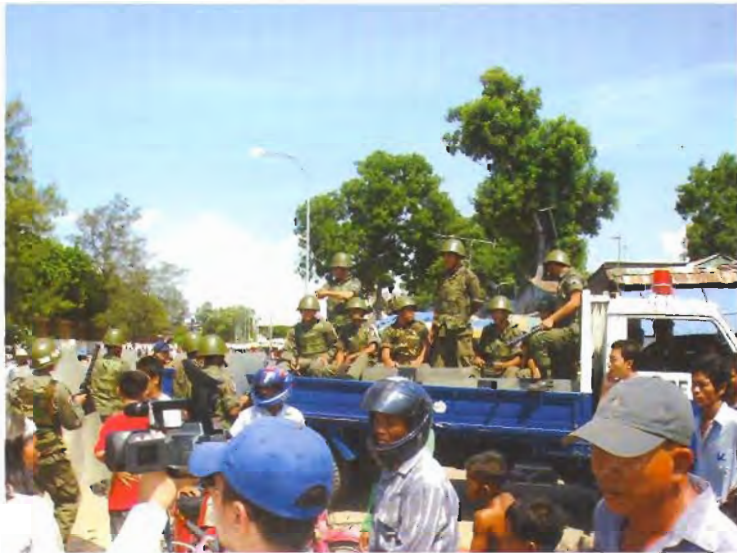
កងកំលាំងប៊ូលីសត្រូវចរណ៍ឱ្យអ្នកស្រុក មេឃូពីសធម៌ចំបាសាក់ (សំបុកចាប)